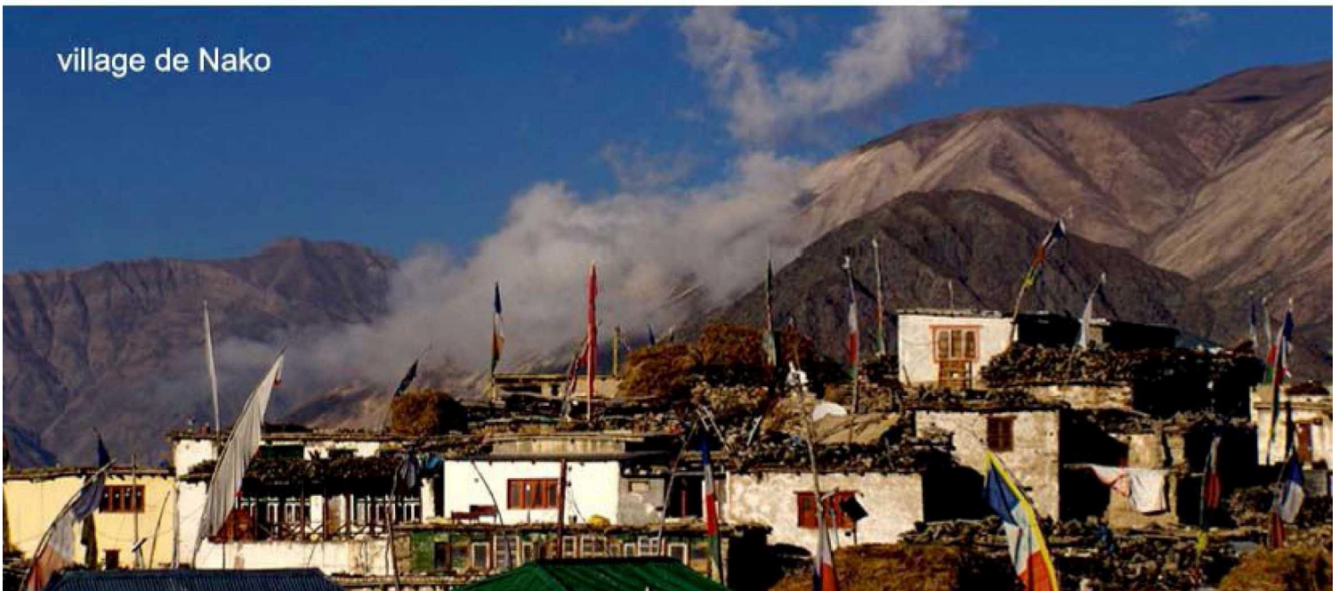
village de Nako

- Nous franchirons l'imposant col du Kunzum (4500 m) et la région sauvage du Lahaul et le col du Rothang (4000m) pour retrouver enfin la verdure de la vallée de Kullu.